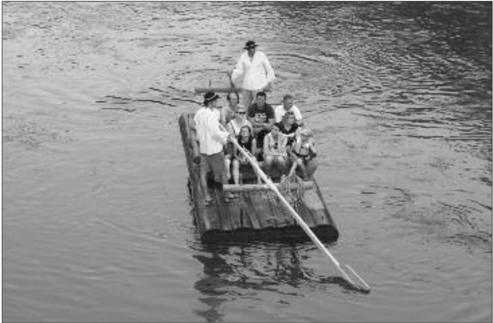
Obr. č. 7: Turisté na plti. Oravský Podzámok 2015, Foto: Aleš Smrčka.