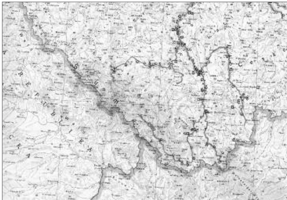
Obr. č. 1 : Mapové podklady s vyznačenými významnými místy pro plavce (obce, hospody...). Vladimír Scheufler. EU AV ČR SVI, archiv, OF Scheufler, sign. III. A. 6 -b.