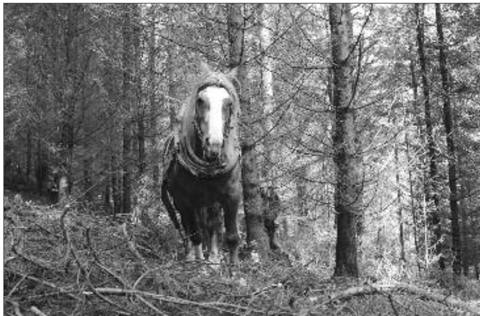
Obr. č. 6: Stahování dříví koňským potahem na Šumavě. Hartmanice (Šumava) 2013, Foto: Aleš Smrčka.

konkrétně z velkého dotazníku zaměřeného na tradiční zemědělské nářadí, který je ale v archivu České národopisné společnosti nyní veden jako ztracený. 11 Značný potenciál v oblasti výzkumu stále představují právě dotazníky tehdejší Československé národopisné společnosti. Nalezneme v nich cenné, v případě velkého dotazníku věnovaného každodennímu životu rolnického obyvatelstva v období před socialistickou kolonizací, dosud nezpracované informace i k tématu tradiční dopravy. 12 Přitom nelze opominout ani význam tištěných a obrazových materiálů zaslaných dopisovateli. 13 (Obr. č. 4 – 5) Dopravě je věnovaná pozornost rovněž v Etnografickém atlasu Slovenska (Paríková, 1990: 34–36). V rámci středoevropského prostředí se tématu tradiční dopravy věnoval rovněž Maďarský etnografický atlas (Paládi-Kovács, 1987: 191–205) a na začátku sedmdesátých let minulého století Polský etnografický atlas , konkrétně např. Zygmunt Kłodnicki (1974). 14