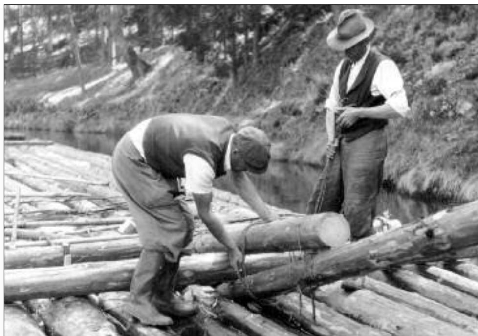
Obr. č. 2: Vypínání vejpony sýkorou, VA8 - př. č. 360014 (54)